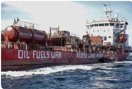
Första gästerna kom från detta fartyg.