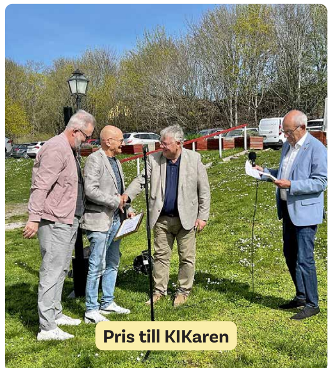
Pris till KIKaren