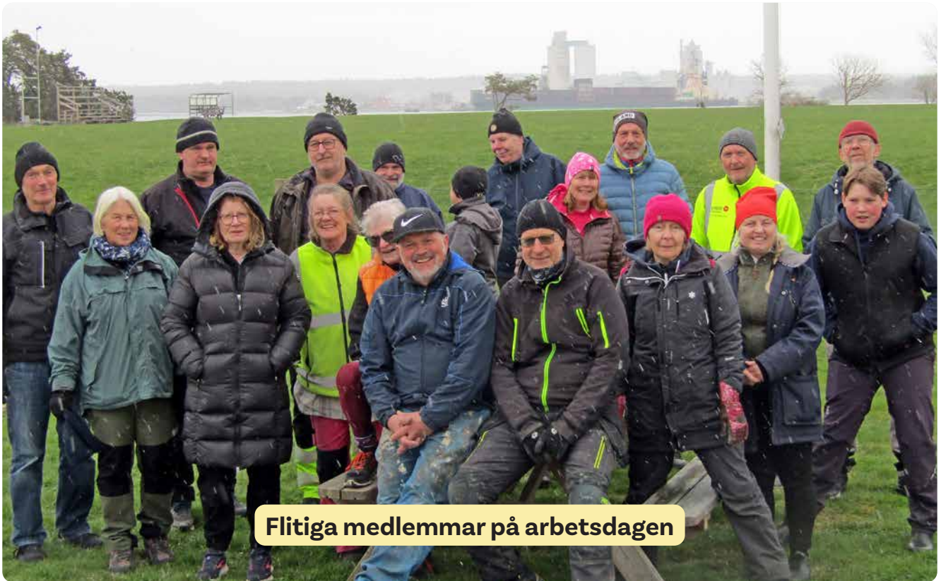
Flitiga medlemmar på arbetsdagen